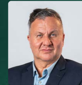
Julio Mota Outsourcing