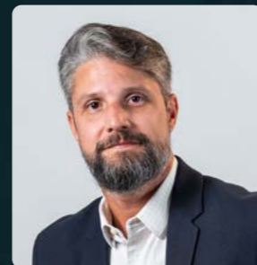
Felipe Vieira Consultoria Tributária