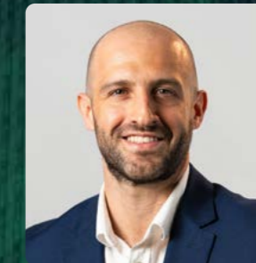
Rafael Atalla Outsourcing