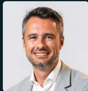
André Simões Auditoria e Outsourcing