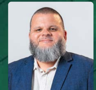
Walter Neumayer Auditoria Externa e Consultoria Contábil