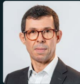
Alexandre Bragança Transaction Services