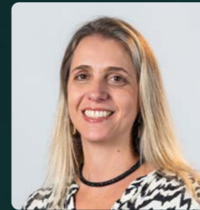
Fernanda Rorato Consultoria Tributária